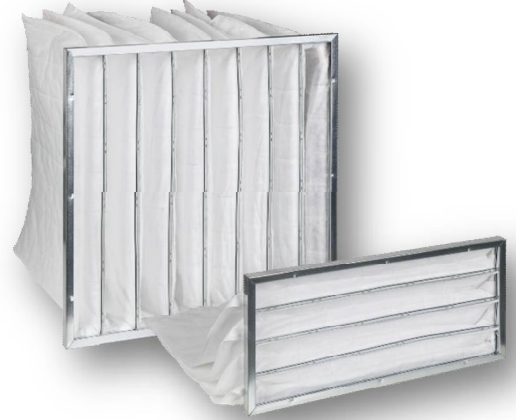
FINEBAG GS - M5