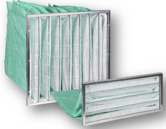
FINEBAG GS - M6